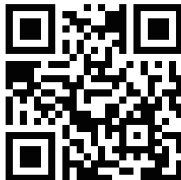
ログイン QR コード